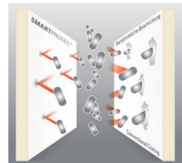
Antimikrobielle Pulverbeschichtung SmartProtec®