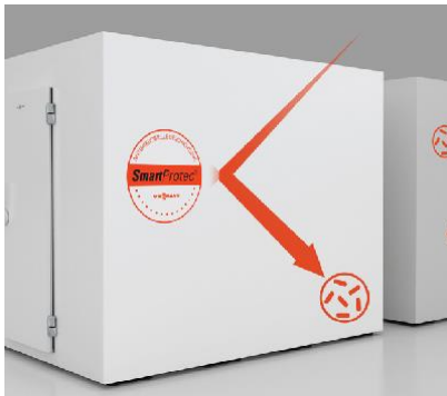
Antimikrobielle Pulverbeschichtung SmartProtect®